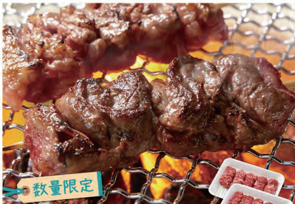
数量限定 27 いわいずみ短角牛 串焼き