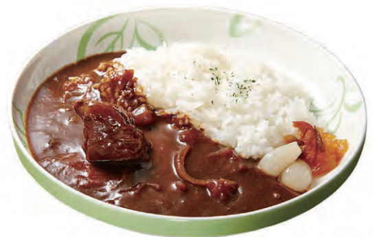
32 いわいずみ短角牛100% ビーフカレー6個入

岩泉牛乳を使用した濃厚なクリームシチューと短角牛肉を使用したビーフカレーをセットでお届けいたします。