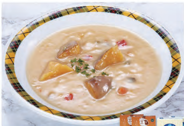
31 岩泉クリームシチュー & ビーフカレー

クリームシチュー 200g×2 / ビーフカレー 210g×2 常温 2,900円