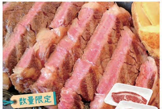
数量限定 28 いわいずみ短角牛 肩ロースステーキ