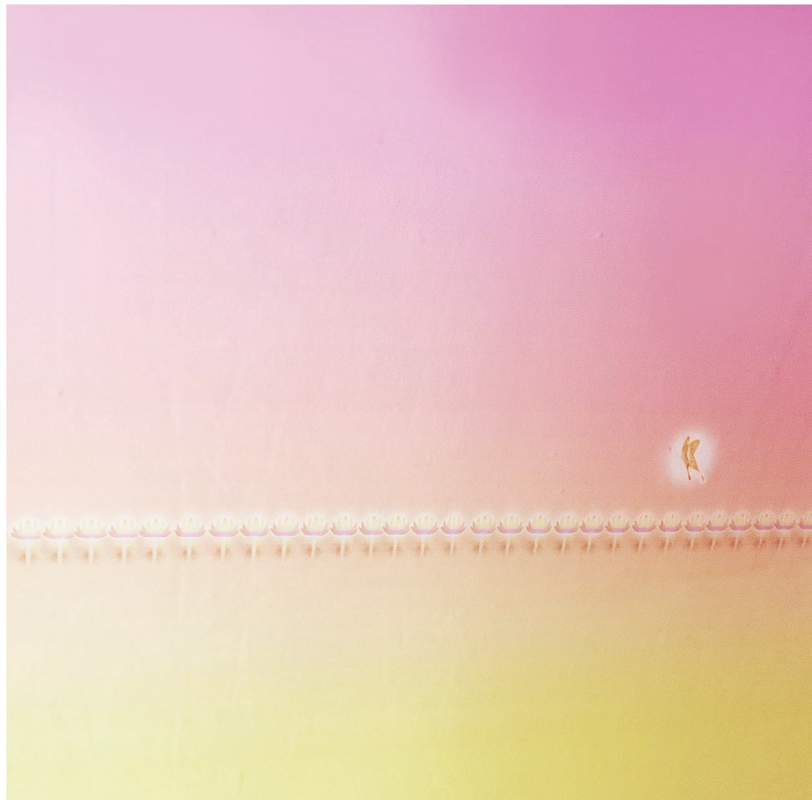
TERA 1991 Computer graphics